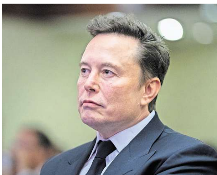
Elon Musk, Tech-Milliardär und Besitzer von Tesla und X, setzt auch im neuen Jahr seine öffentliche Unterstützung für Rechtsextreme und Anwürfe gegen gewählte Politiker in Europa fort.